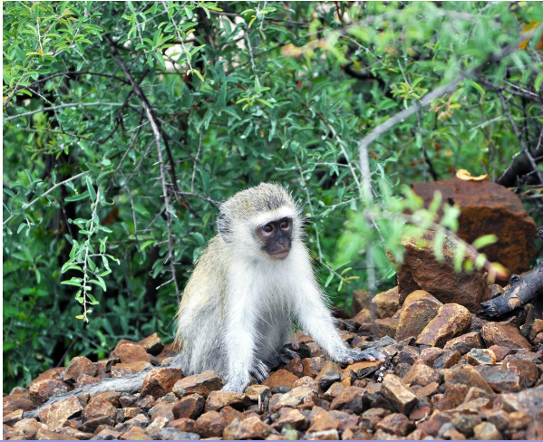
S. Zucchi: Le voci dei vervet